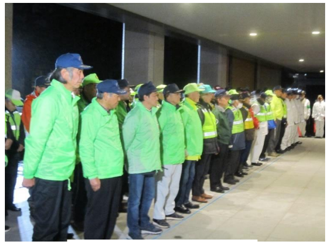
自主防犯パトロール隊