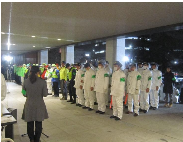
自主防犯パトロール隊

12月6日（金）午後6時30分から富山県議会議事堂前で年末特別警戒合同パトロール出発式が行われました。出発式では、新田知事から長尾隊員が激励品の交付を受けた後、松浦理事長が出発宣言を行い、自主防犯パトロール隊21団体、約85人が、青色回転灯を点灯した防犯パトロール車23台に分乗し、知事や警察本部長らの見送りを受け各方面に向けてパトロールに出発しました。