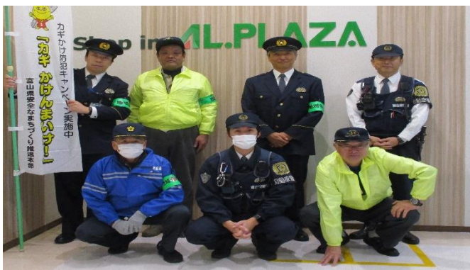
ファボーレキャンペーン