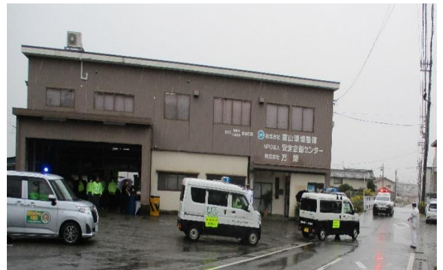
パトロール隊の出発